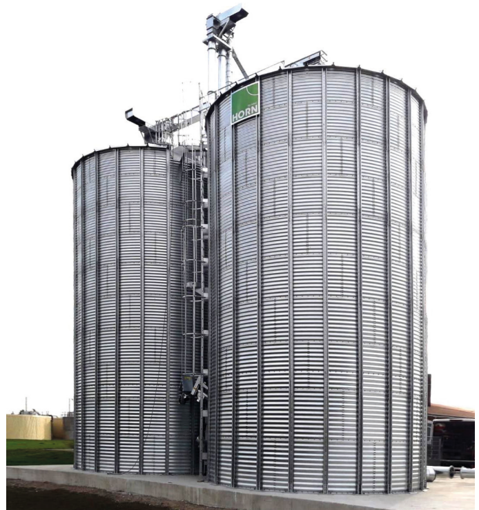
Außensilo mit Trogschnecke