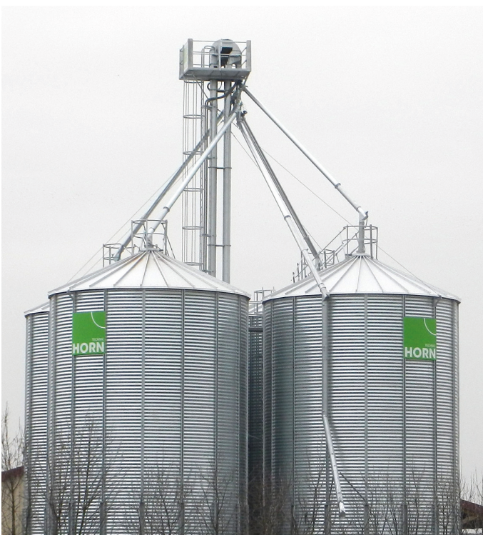
Außensilo mit Podest

Dadurch entfällt das schwierige und maßgenaue Einbetonieren von Betonankern. Auch kann das Silo nach dem Aufstellen noch positioniert werden, soweit dies erforderlich ist. Modernste elektrische Aufstellwinden, die das Silo auch in der Aufbauphase gegen Wind stabilisieren, gewährleisten in Verbindung mit einem routinierten Silo-bau-Richtmeister die optimale Aufstellsicherheit, verbunden mit einer schnellen Montage. Die Abdichtung der Silos am Boden erfolgt mit einer Spezial-dichtungsmasse. Vorteilhafter ist es, nach Verankerung des Silos innerhalb desselben nochmals eine 15 cm bis zu 30 cm Betonfüllung einzubringen, wobei generell darauf zu achten ist, die Metallteile durch Anstrich mit Teerfarbe vor dem Beton zu schützen.