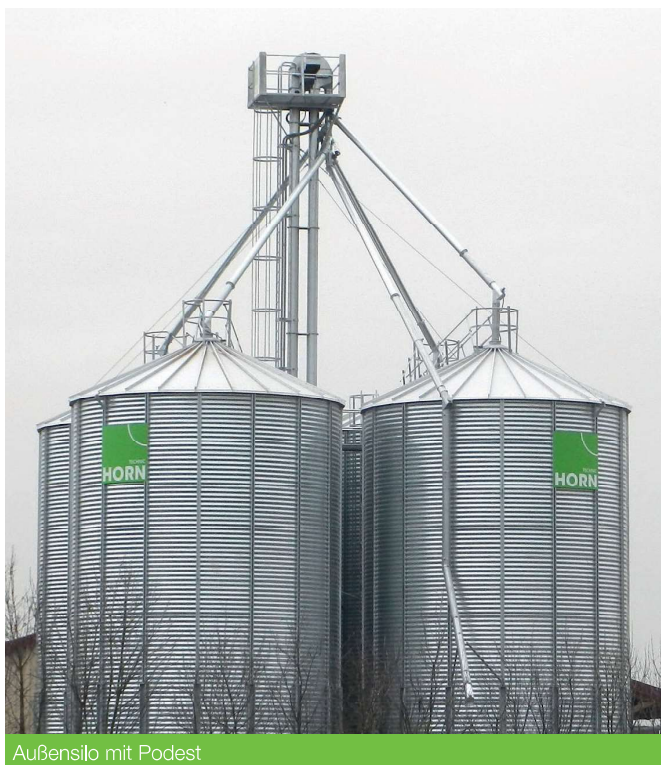
Außensilo mit Podest

Dadurch entfällt das schwierige und maßgenaue Einbetonieren von Betonankern. Auch kann das Silo nach dem Aufstellen noch positioniert werden, soweit dies erforderlich ist. Modernste elektrische Aufstellwinden, die das Silo auch in der Aufbauphase gegen Wind stabilisieren, gewährleisten in Verbindung mit einem routinierten Silobau-Richtmeister die optimale Aufstellsicherheit, verbunden mit einer schnellen Montage. Die Abdichtung der Silos am Boden erfolgt mit einer Spezial-dichtungsmasse. Vorteilhafter ist es, nach Verankerung des Silos innerhalb desselben nochmals eine 15 cm bis zu 30 cm Betonfüllung einzubringen, wobei generell darauf zu achten ist, die Metallteile durch Anstrich/Pulverbeschichtung zu schützen.