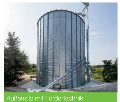
Außensilo mit Fördertechnik