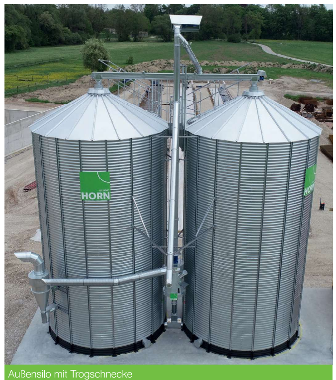
Außensilo mit Trogschnecke