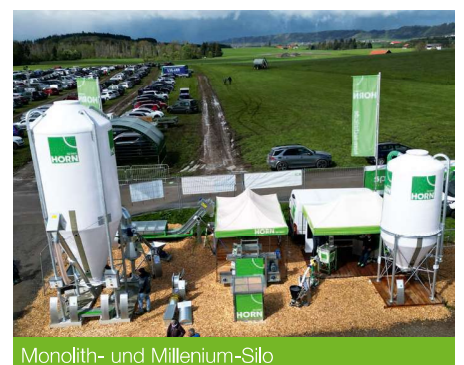
Monolith- und Millenium-Silo